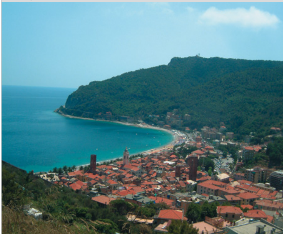
Veduta del golfo

ranea rigogliosa, caratterizzata dalla presenza di specie vegetali e animali uniche, come il Vilucchio di Capo Noli e la Lucertola Ocellata . Per gli amanti degli sport nel verde, parapendio, arrampicata, trekking ed escursioni in mountain bike e a cavallo sono occasioni da non perdere. Sulla spettacolare falesia calcarea a picco sul mare, immediatamente sotto la via Aurelia, sono svariati i percorsi interessanti per gli appassionati di free climbing . Noli è uno degli ultimi luoghi d'Italia dove sopravvive la pesca artigianale, eseguita con la rete issata sui tradizionali gozzi liguri. Gli stessi pescatori vendono poi, ogni mattina sul lungomare, il pesce appena catturato.