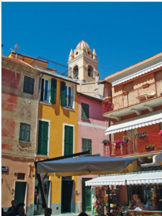
Vista del campanile da piazza Dante