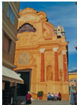
Chiesa della Santissima Annunziata