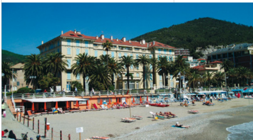
Vista del complesso Palace dal molo Sirio

N ell'ampia insenatura tra punta del Vescovado e la rocciosa punta Maiolo si distende l'abitato di Spotorno: la passeggiata a mare e le lunghe spiagge attrezzate dichiarano subito la vocazione turistica di questo bel paese di Liguria che ha però conservato, nella sua parte più antica, il tipico impianto medievale a sviluppo lineare lungo il percorso costiero. Il paese si articola in due