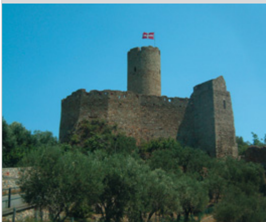
Castello di Monte Ursino

Le origini nolesi sono in gran parte ancora da scoprire. Recenti scavi archeologici indicano però la presenza di un nucleo abitativo di età romana. È comunque nel Medioevo che Noli incomincia a far parlare di sé, acquistando la propria libertà dai marchesi Del Carretto, feudatari della zona, con atto firmato nella chiesa di San Paragorio il 7 agosto 1192, oggi ricordata con una festa in costumi storici. Noli manterrà poi la sua autonomia fino all'avvento della Repubblica Ligure (1797). Nei secoli XIII e XIV l'antica Nauli, grazie all'attività mercantile che svolgeva in tutto il Mediterraneo a fianco dell'alleata Genova, divenne un ricco centro urbano con circa 72 torri e numerose case-torri.