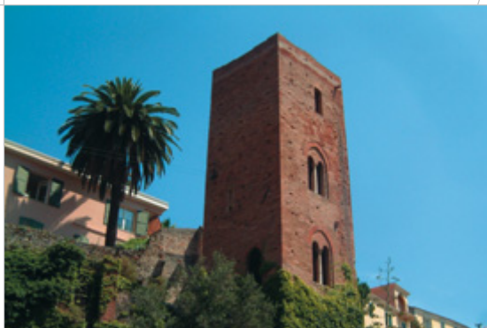
Torre di Papone