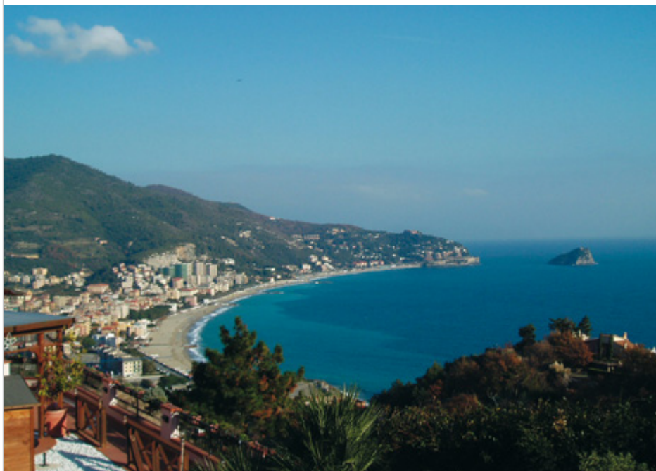
Vista del golfo di Spotorno, ripreso dalla località Chiariventi