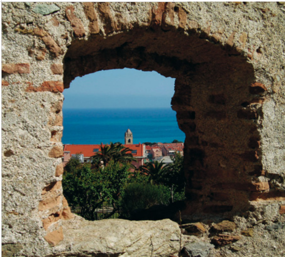
Scorcio del paese visto dalla facciata sud del Castello Vescovile di Spotorno

dalla linea ferroviaria Genova-Nizza. Ebbe così inizio una fase di radicale cambiamento della vita e delle attività degli abitanti: le spiagge, fino a quel momento luoghi dedicati alla pesca e alla costruzione delle navi, divennero meta del primo turismo marittimo.